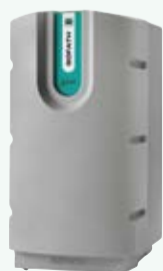
AG200 Hauteur : 133 cm Largeur : 67 cm Profondeur : 77 cm