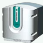
AG100 Hauteur : 73 cm Largeur : 67 cm Profondeur : 77 cm