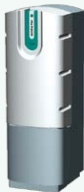
AG300 Hauteur : 190 cm Largeur : 67 cm Profondeur : 77 cm